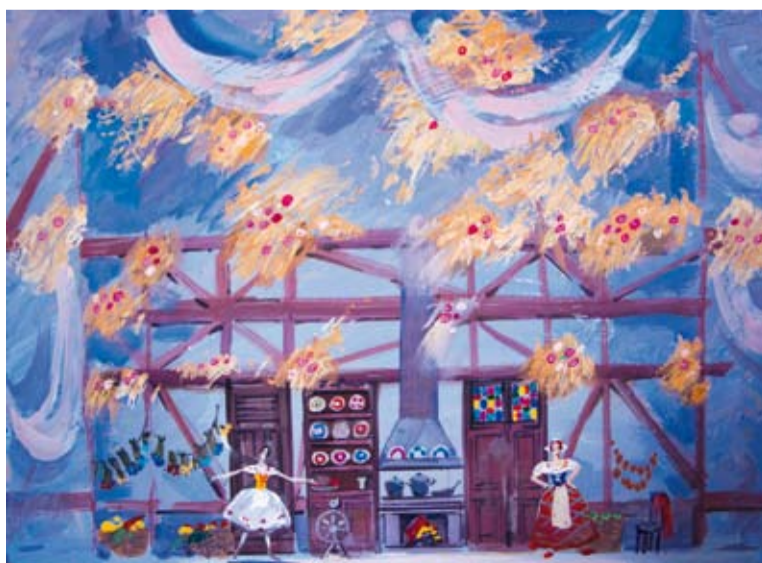
Тщетная предосторожность. Двп. Смеш. техника. 2012 г.