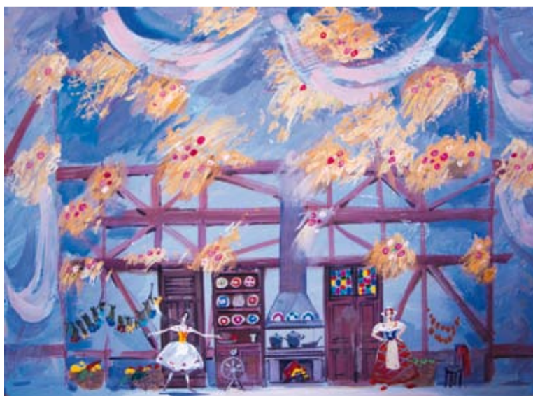
Тщетная предосторожность. Двп. Смеш. техника. 2012 г.

С эпохи Серебряного века театральный художник, создающий целостную предметно-пространственную среду спектакля, становится одним из его соавторов. Эскизы сценографии и костюмов – самостоятельные живописные произведения, которые, даже будучи законченными, имеют свою дальнейшую жизнь. Театральный зритель обычно видит только конечный результат этого длительного и непростого пути. Со многими театральными тайнами зрители познакомились на выставке Натальи Хохловой «Театральный вернисаж». Творческое кредо ху-