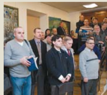
Открытие выставки «На волжских берегах»