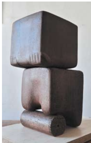
Рабы. Керамический цикл.

Шерешевский и сам создает современные мифы. Например,