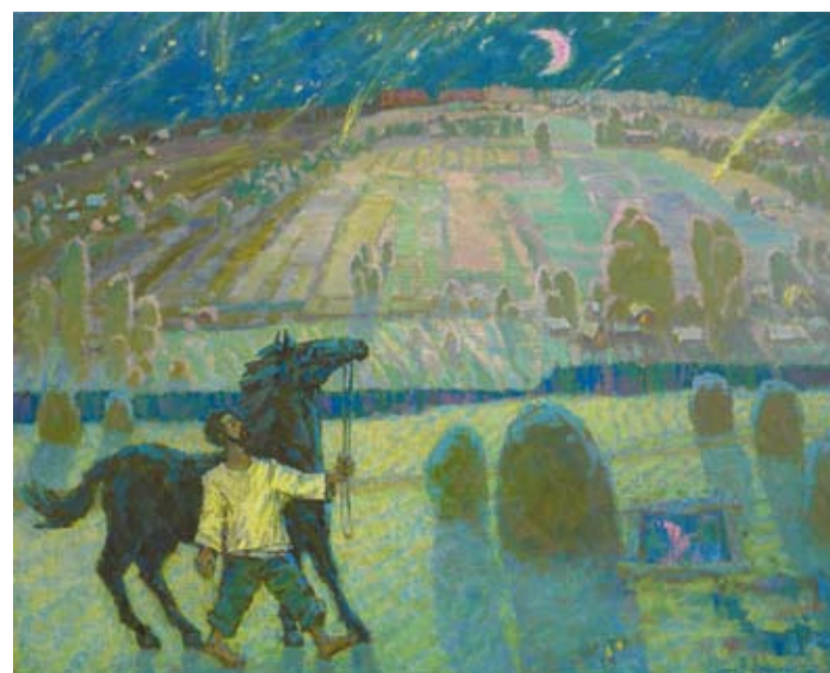
Летняя ночь. X, м. 2011.

тонального и цветового письма. Работы наполнены прозрачным, восхитительным в своей реальности воздухом. Чтобы так передать световоздушную среду, надо не только выйти на природу, но и по-новому увидеть обыденность, отказавшись от многих правил, и полностью довериться собственной интуиции. Таковы пленэрные работы художника. Эту пленэрную све-