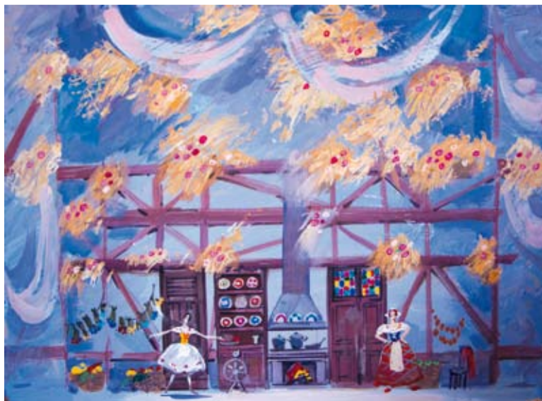
Тщетная предосторожность. Двп. Смеш. техника. 2012 г.

С эпохи Серебряного века театральный художник, создающий целостную предметно-пространственную среду спектакля, становится одним из его соавторов. Эскизы сценографии и костюмов – самостоятельные живописные произведения, которые, даже будучи законченными, имеют свою дальнейшую жизнь. Театральный зритель обычно видит только конечный результат этого длительного и непростого пути. Со многими театральными тайнами зрители познакомились на выставке Натальи Хохловой «Театральный вернисаж». Творческое кредо ху-