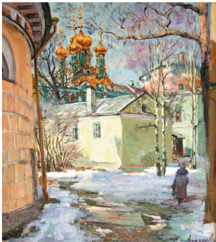
«Пушкин. Лицейский переулочек». Х., м. 73х63 см, 2005 г.

- У творчества нет территориальных границ. Валентин Скачков очень много ездит по миру, пропагандируя с помощью своих выставок русское изобразительное искусство. Я рад, что и у нас в Самаре любители живописи смогли познакомиться с творчеством этого замечательного художника.