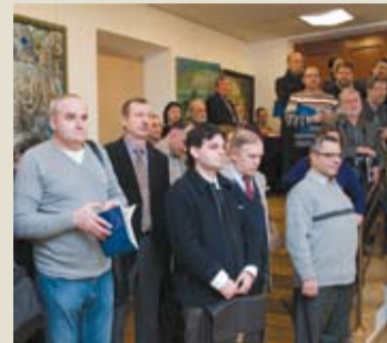
Открытие выставки «На волжских берегах»

корреспондент РАХ Г.С. Ушаев. Завершился вечер небольшой концертной программой. Пиан-