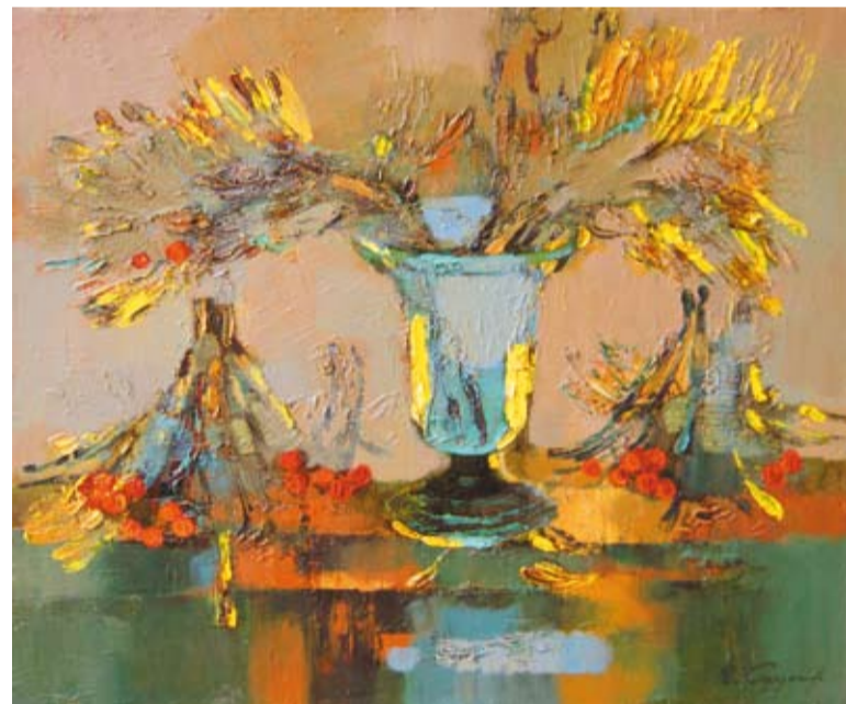
Бабье лето. Карт., м. 50x60, 2012 г.