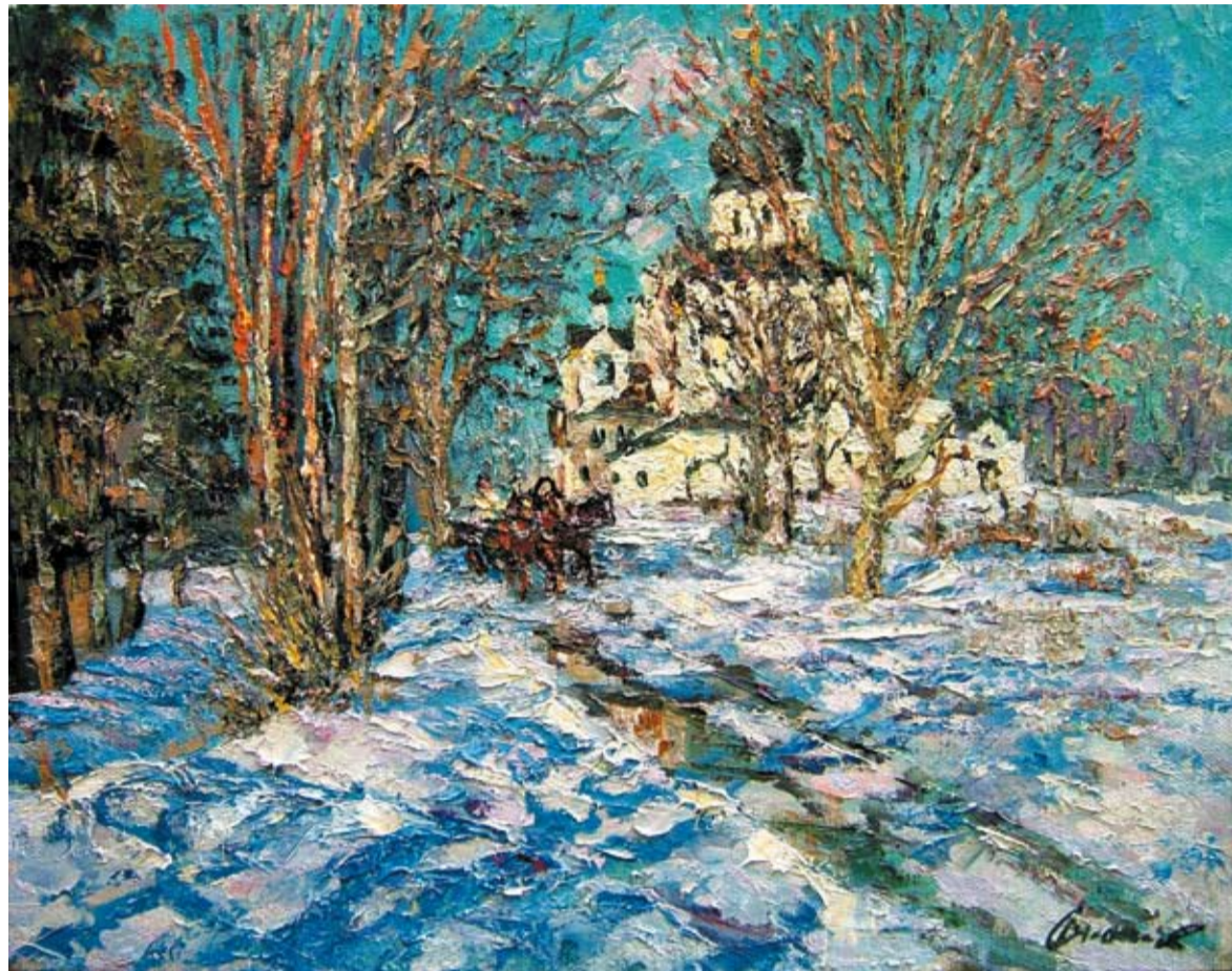
«Феодоровский собор». Х., м. 50х60 см, 2005 г.