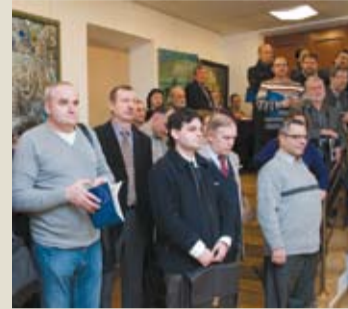
Открытие выставки «На волжских берегах»

корреспондент РАХ Г.С. Ушаев. Завершился вечер небольшой концертной программой. Пиан-