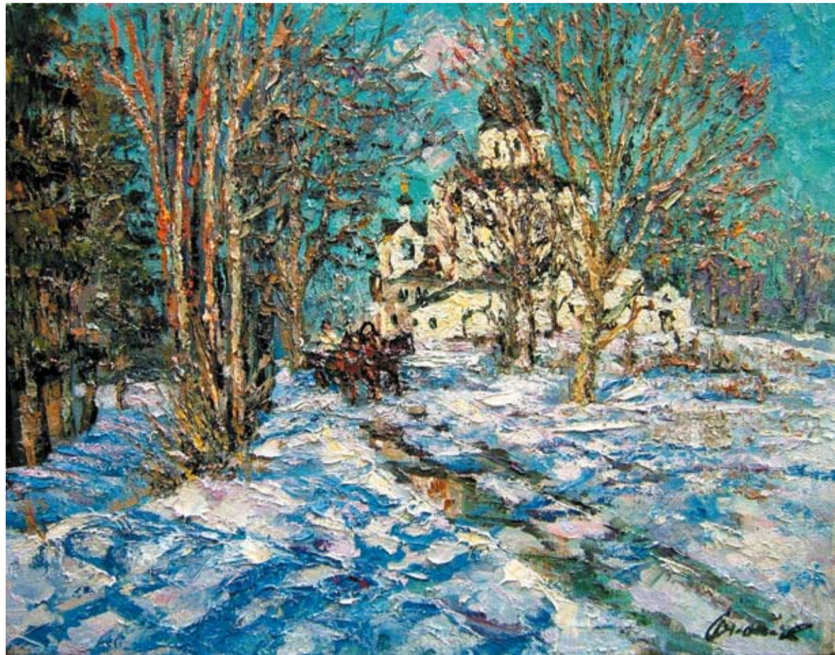
«Феодоровский собор». Х., м. 50x60 см, 2005 г.