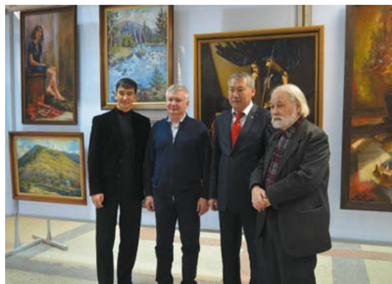
Организаторы выставки и участники конкурса из Казахстана