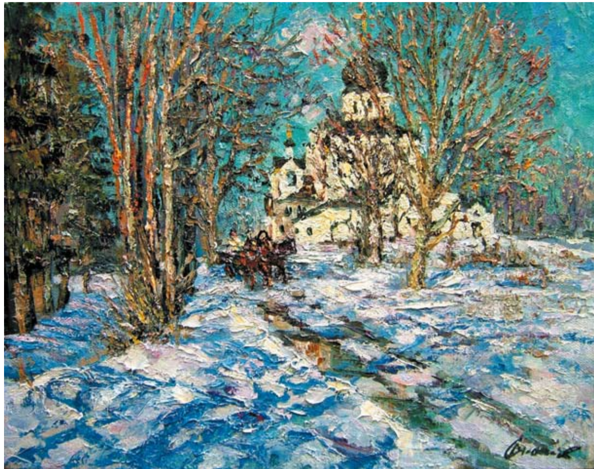
«Феодоровский собор». Х., м. 50x60 см, 2005 г.