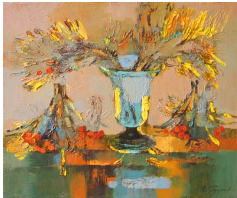
Бабье лето. Карт., м. 50x60, 2012 г.