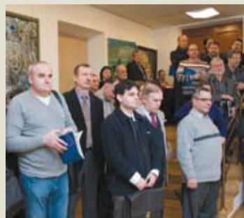
Открытие выставки «На волжских берегах»

корреспондент РАХ Г.С. Ушаев. Завершился вечер небольшой концертной программой. Пиан-