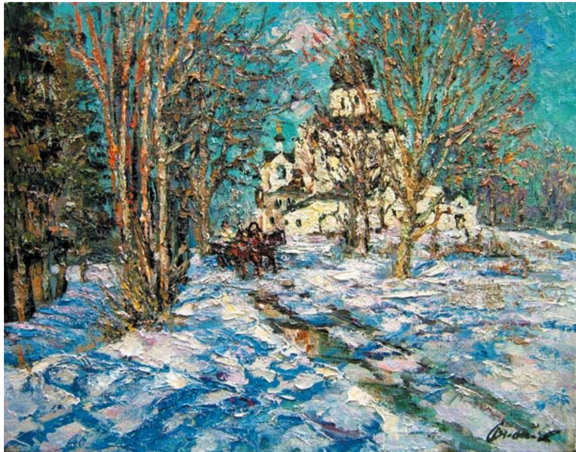
«Феодоровский собор». Х., м. 50х60 см, 2005 г.