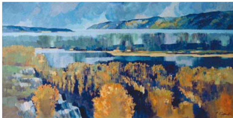
Волга у Царевщины. Карт., м. 70x130, 2012 г.

Первый период самостоятельного творчества Галины Суздальцевой в 1970-80 гг. связан прежде всего с выполнением заказов в области монументальной живописи. Так, одной из первых работ, выполненных в Куйбышеве, стала композиция в технике сграффито для Детского проти-