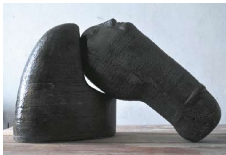
Кентавры. Керамический цикл

Шерешевский и сам создает современные мифы. Например,