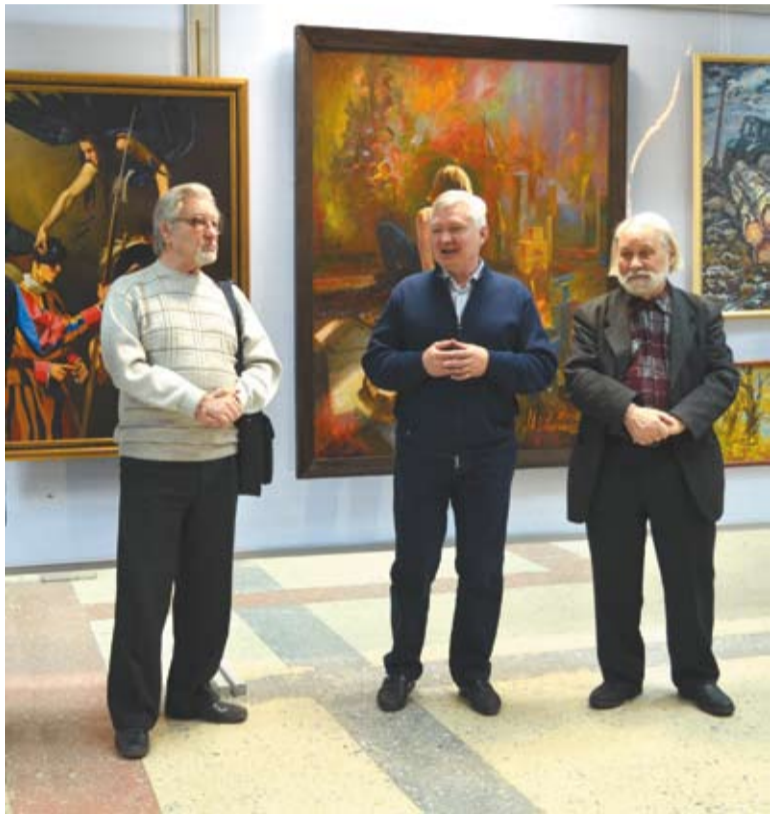
Открытие выставки-конкурса произведений молодых художников «Возвращение домой»

В Самарском отделении Союза художников России состоялся конкурс работ молодых художников, который проводится ежегодно уже четвертый раз. Конкурс и выставка в его рамках определили основные векторы развития искусства молодых, для самих художников стали вехой в освоении профессии.