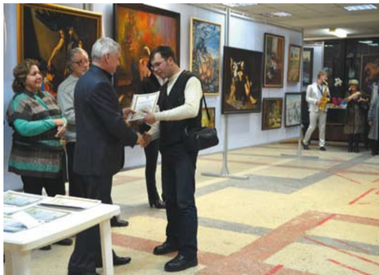
Вручение дипломов лауреатам конкурса

Выставка конкурсных работ в целом производит положительное впечатление. Сильные и слабые стороны в произведени-