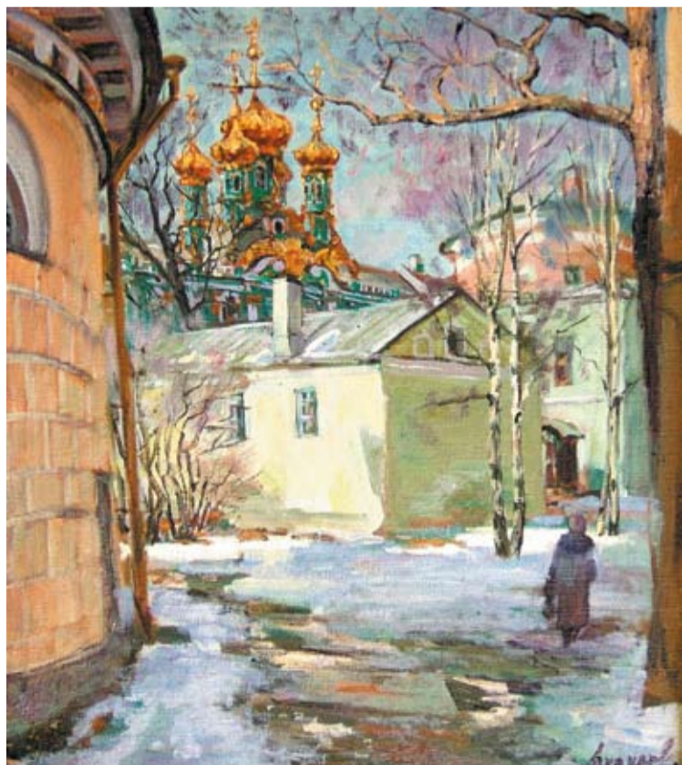
«Пушкин. Лицейский переулочек». Х., м. 73x63 см, 2005 г.